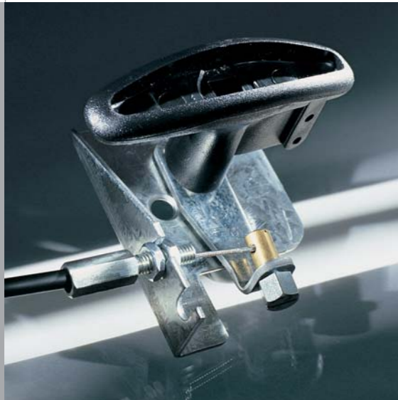
Ejemplo: Juego de desbloqueo

Seguridad y confort mediante técnica – esa es la base para todos los productos de Marantec. A todos los automatismos y accesorios se les plantean las máximas exigencias – y también las satisfacen. Para ello, los ingenieros de Marantec desarrollan constantemente nuevas y mejores soluciones, a menudo incluso superando en mucho las prescripciones legales vigentes. Lo esencial a la hora de desarrollar un producto consiste en contemplar el sistema en su totalidad, es decir el automatismo junto con la puerta. Sólo así es posible garantizar de forma óptima la seguridad y el confort.