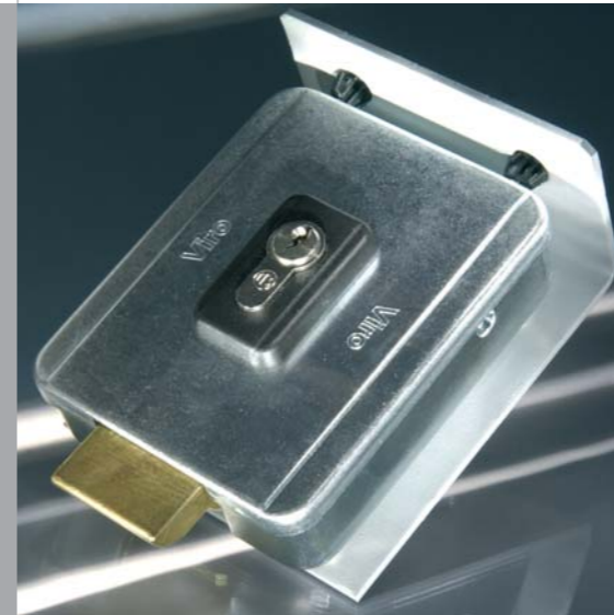
Ejemplo: Cerradura eléctrica

Las cerraduras eléctricas aseguran la puerta por medio de un bloqueo mecánico. Poco antes de la marcha, este bloqueo se desactiva por medio de electroimanes. Las cerraduras eléctricas protegen los sistemas de puertas batientes contra la carga del viento y contra el vandalismo.