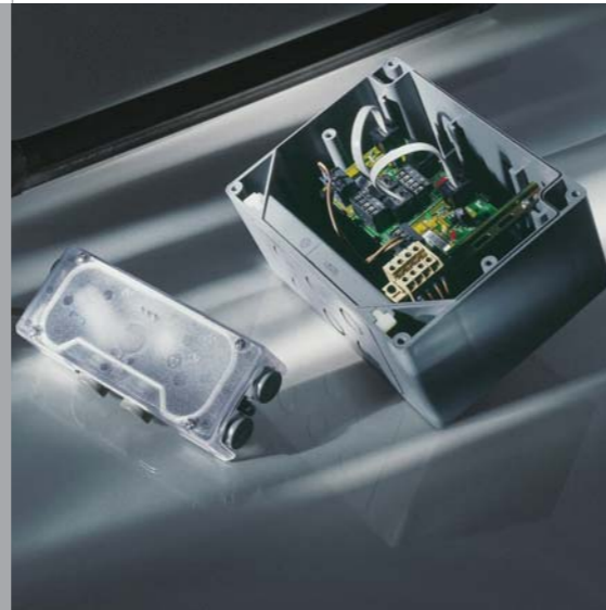
Ejemplo: Sistema antiplastamiento

El set de desbloqueo permite mecánicamente abrir la puerta.