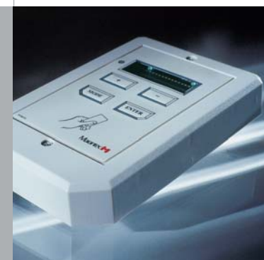
Sistemi a transponder Command: per gestire fino a 1.000 utilizzatori!

I sistemi a transponder di Marantec permettono la gestione intelligente degli accessi per un massimo di 1.000 utilizzatori. Consistono di un modulo base, un modulo di lettura ed un gruppo di collegamento alla rete. Sul modulo base viene effettuata in modo molto semplice la programmazione delle tessere con il transponder. Inoltre è possibile abbinare ad un singolo modulo base vari moduli di lettura, per gestire l'accesso degli utenti da vari punti d'entrata, con un massimo di 1.000 utilizzatori e senza necessità di collegamenti a PC o sistemi online. I sistemi a transponder sono ideali in combinazione con automazioni di tipo industriale, barriere automatiche per parcheggi oppure automazioni di entrate condominiali.