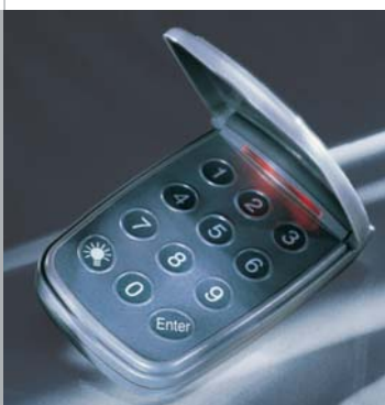
Tastiere a codice Command: per entrare in casa senza chiavi!

Le tastiere a codice di Marantec sono un sistema sicuro per comandare un'automazione anche senza chiavi. Inserendo un codice PIN personale è possibile aprire e chiudere porte e cancelli. La programmazione delle tastiere a codice è intuitiva e veloce ed è possibile scegliere tra modelli cablati in modo tradizionale e modelli con funzionamento radio. Inoltre la tastiera numerica comprende anche un tasto che comanda separatamente la luce di cortesia dell'automazione oppure l'illuminazione del garage. Tutte le tastiere sono un sistema di comando ideale per l'installazione esterna e per un uso particolarmente frequente.