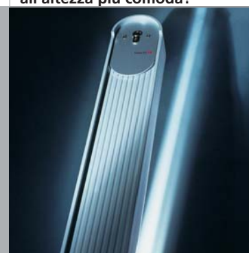
Colonnine di comando Command: per avere gli accessori di comando all'altezza più comoda!

Il selettore a chiave inserito nella colonnina permette di aprire e chiudere il cancello o il garage senza dover scendere dall'automobile, anche quando non si ha a portata di mano un radiocomando. La colonnina con i suoi 1.090 mm permette di installare il selettore all'altezza più comoda e lo protegge perfettamente dalle intemperie grazie alla sua robusta costruzione in alluminio, che le conferisce inoltre un design elegante ed adeguato per ogni ambiente. Le colonnine Marantec sono una soluzione ideale soprattutto per garage pubblici ed entrate condominiali, utilizzate da molti utenti diversi.