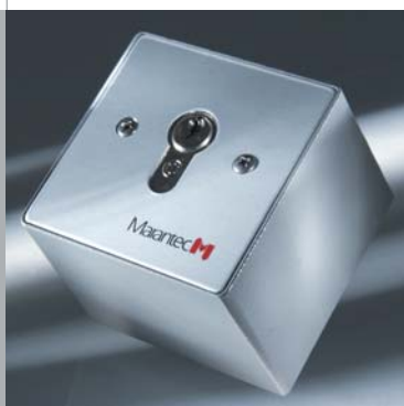
Selettori a chiave Command: uno per tutti!

I selettori a chiave Marantec sono disponibili nelle versioni da incasso oppure esterna. In entrambi i casi la mascherina protettiva è realizzata in alluminio per garantire una lunga durata del selettore, un'ottima resistenza alle intemperie ed un design elegante. I selettori possono essere cablati in modo da funzionare a scelta con IMPULSO passo-passo oppure con IMPULSO di direzione APERTURA-CHIUSURA. In combinazione ad esempio con una pulsantiera radio, possono inoltre essere installati con un cablaggio ridotto, per un montaggio più veloce ed economico.