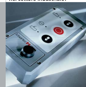
Tastiere Command: anche per l'utilizzo nel settore industriale!

Oltre alla gamma classica di tastiere per l'uso residenziale, Marantec offre prodotti specificatamente studiati per l'utilizzo nel settore industriale. Ad esempio le tastiere industriali possono essere chiuse a chiave, per evitare che vengano utilizzate da personale non autorizzato. Oltre alle funzioni di APERTURA e CHIUSURA prevedono anche un pulsante specifico di STOP, per arrestare la porta in movimento in caso di emergenza. Inoltre le porte sezionali industriali possono essere comandate anche tramite un interruttore a cavo pendente. Infine le tastiere industriali possono essere installate sia al coperto che all'aperto.